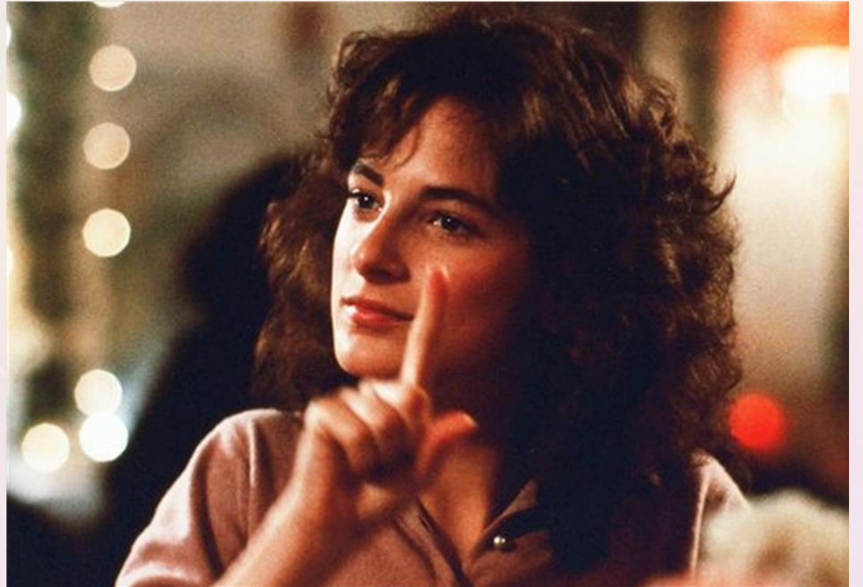
Marlee Matlin.